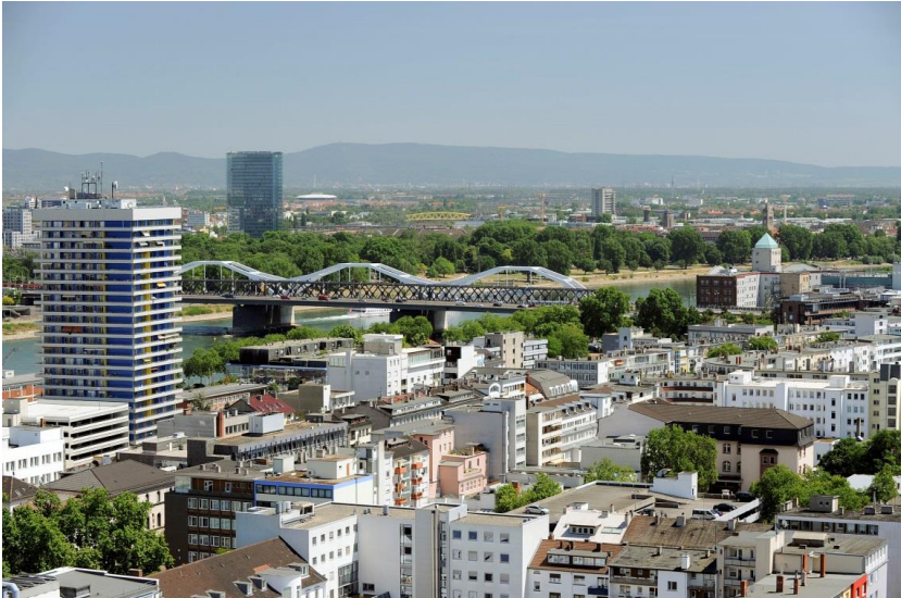
Blick über die Ludwigshafener Innenstadt