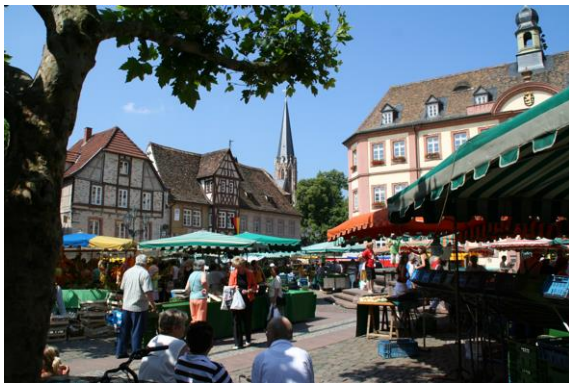
Der Marktplatz ist das Herz der historischen Altstadt